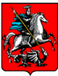
Герб Москвы 1993 г.

- Рассмотрим изображение на российском гербе.